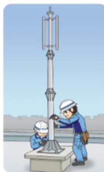
携帯電話無線基地局の建設

モバイル通信の技術環境は急激な進歩を遂げ、数年前の技術が役に立たなくなるほどダイナミックな変化を続けています。