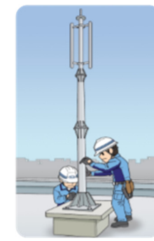
携帯電話無線基地局の建設

モバイル通信の技術環境は急激な進歩を遂げ、数年前の技術が役に立たなくなるほどダイナミックな変化を続けています。